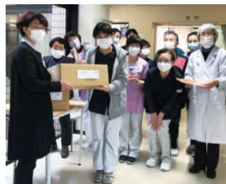
老人保健施設なでしこの丘