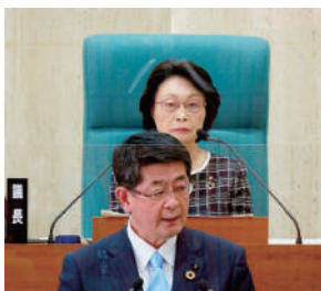
2月議会 相川市長職務代理