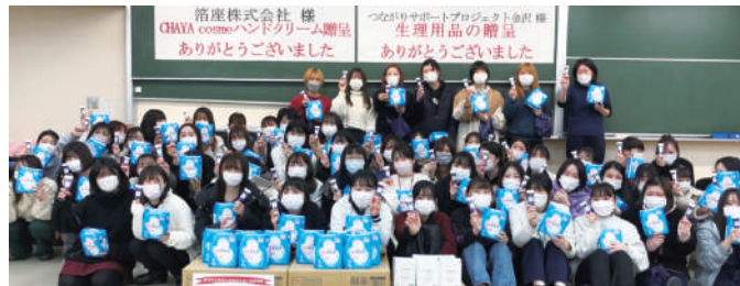
金沢医療技術専門学校

なお、1月20日・21日に市内の保育・福祉介護・看護の専門学校7校の学生に生理用品とハンドクリームを贈呈しました。