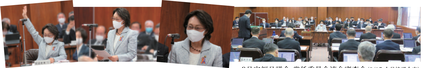
3月定例会月議会 常任委員会連合審査会(3/17 全員協議会室)